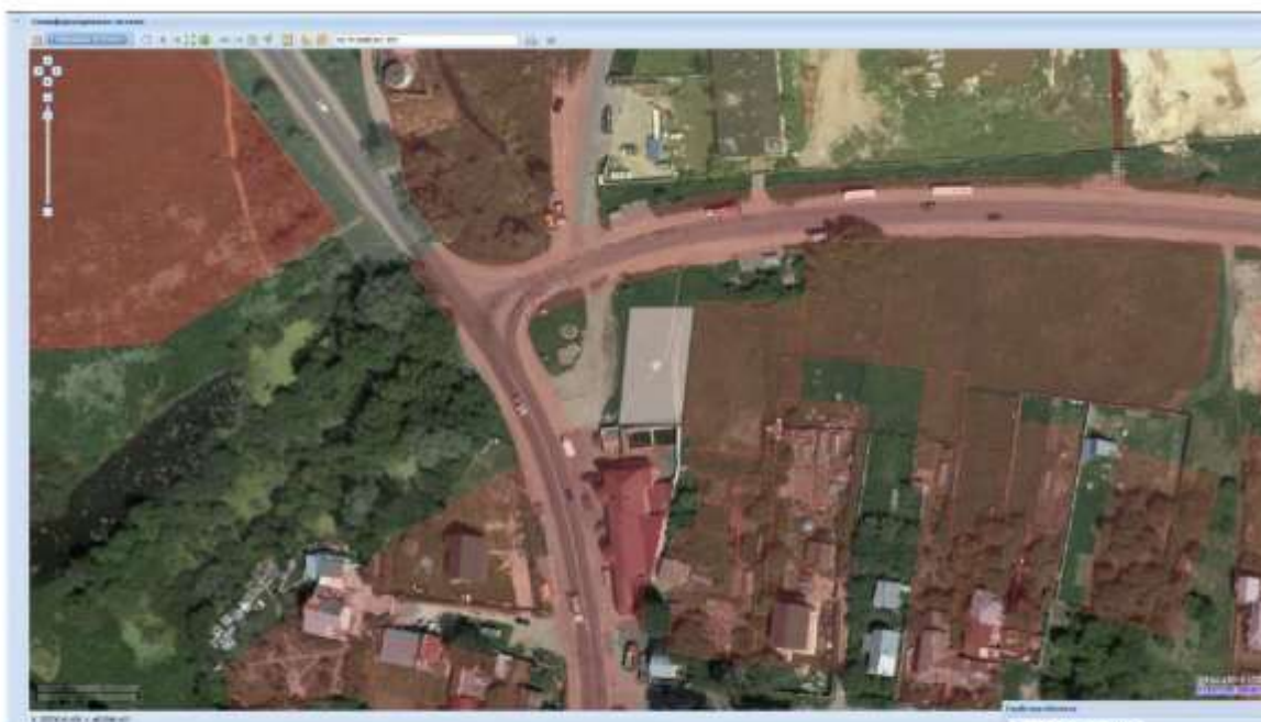
Фактическое местоположение земельного участка